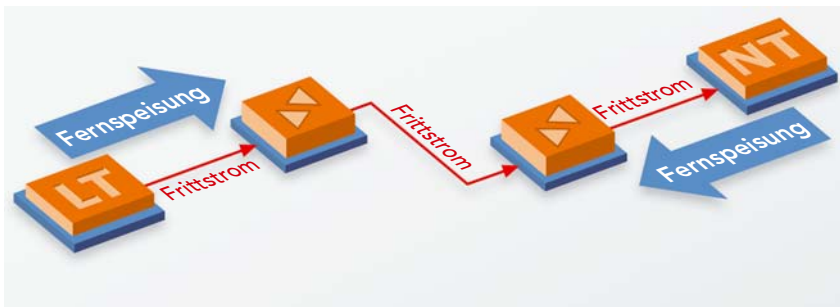
Fernspeisung und Frittstrom in einem SHDSL-Übertragungssystem